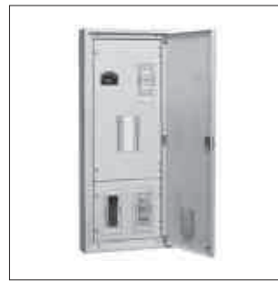
LTGタイプ(主幹:漏電遮断器)